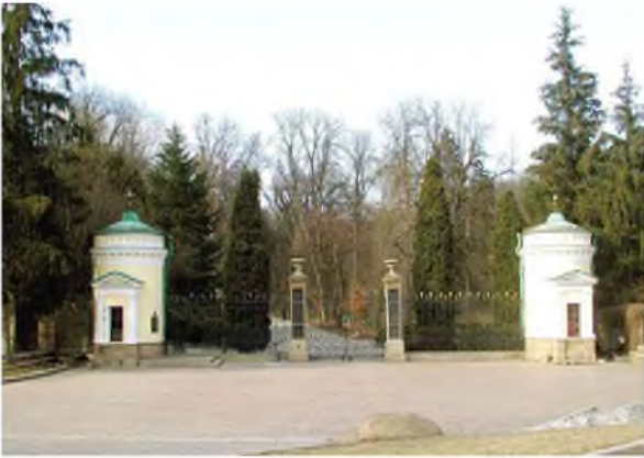
Головний вхід в парк, 1850-1852 рр. Проект А. Штакеншнейдера.

Слід зазначити, що найбільші реставраційні, ремонтні