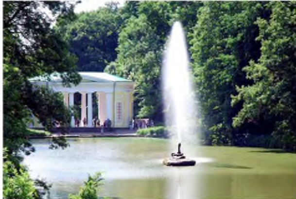
Фонтан "Змія", 1890 р. Загальний вигляд.