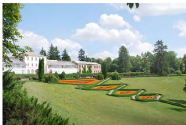
Партерний амфітеатр, реставрація 1996 р. Сучасний вигляд.

Рис. 1. Умань. Національний дендрологічний парк «Софіївка» як видатний твір української архітектури, несе в собі не лише утилітарну, а й естетичну, культурну функцію. Саме він є гордістю українського суспільства, держави. Фото початку XXI ст.