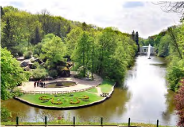
Площа Зборів і Нижній ставок. Вид з Тераси Муз.