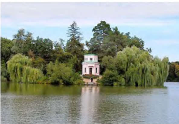
Рожевий павільйон на острові Анти-Цирцеї, 1850-1852 рр. Проект А. Штакеншнейдера.