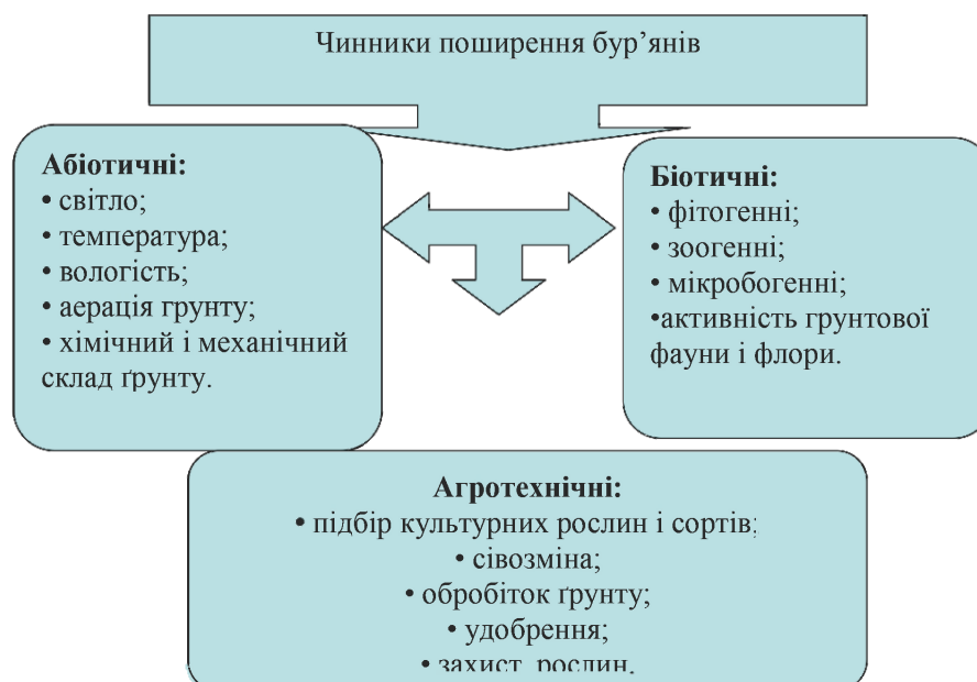
Рис. 1. Класифікація екологічних чинників за впливом на поширення бур'янистої рослинності (особиста розробка авторів)

У наших дослідженнях за ранніх строків сівби куку-