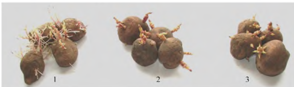
Рис. 1. Дія гібереліну і паклобутразолу на інтенсивність проростання бульб картоплі сорту Поляна. 1- ГКЗ (150 мг/л); 2 - контроль; 3 - ПБ (0,05%); 30-й день проростання

Примітка. * – різниця достовірна при P ≤ 0,05