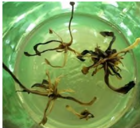
Рис. 4. Загиблі від некрозу рослини-регенеранти