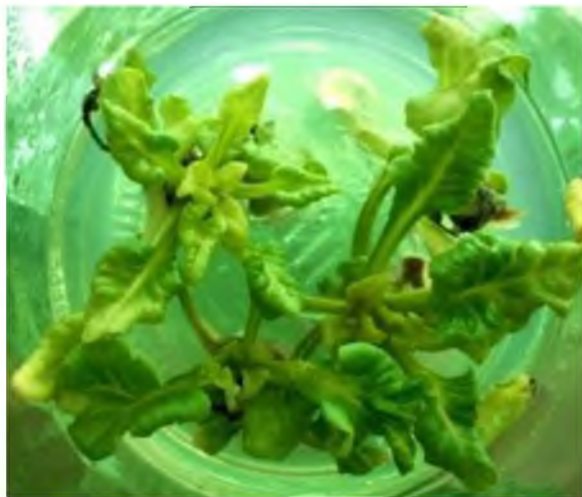
Рис. 3. Початок некрозу рослин-регенерантів

Висновки. У результаті досліджень встановлено, що