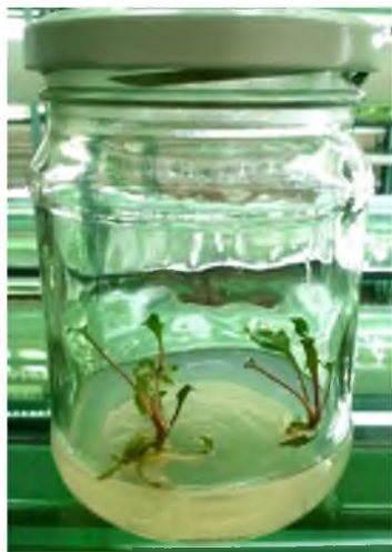
Рис. 1. Розвиток рослин-регенерантів із стерильних життєздатних експлантів

Найефективнішою стерилізуючою речовиною для введення мікроживців в ізолювану культуру визначено 0,1%-ий водний розчин дихлориду ртуті за експозиції 15 хвилин. Вихід стерильних — життєздатних експлантів, з яких невдовзі розвивались рослини-регенеранти у цьому варіанті досліду в середньому складав 96% (рис. 1).