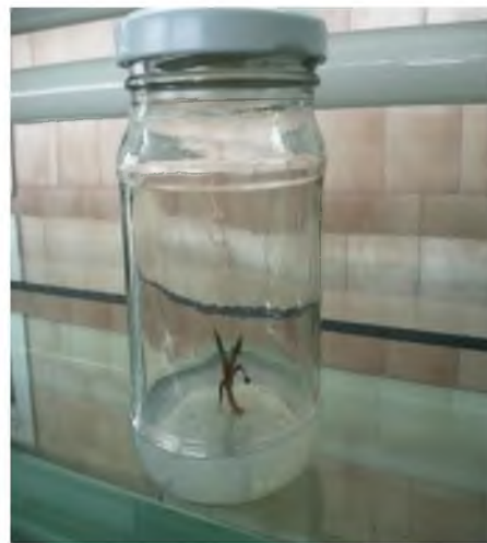
Рис. 2. Стерильні нежиттєздатні експланти

найефективнішим стерилізатором проростків насіння цукрових буряків є 0,1% розчин сулеми при експозиції стерилізації 20 хвилин – 96% стерильного матеріалу.