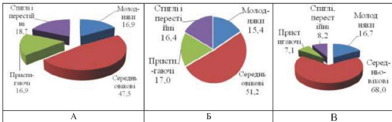
Рис. 2. Розподіл вкритих лісовою рослинністю земель за групами віку в лісовому фонді Державного агентства лісових ресурсів України (А), в ДП «Уманське лісове господарство» (Б), в лісовій дачі «Білогрудівський ліс» (В), %